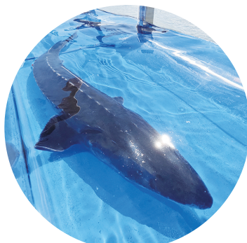
向闽江口水域投放珍稀濒危物种中华鲟200尾

“本次主场活动向闽江口水域投放水生生物285万余尾,其中珍稀濒危物种中华鲟200尾。”6月6日,农业农村部与福建省人民政府在福建省福州市联合举行“养护水生生物 建设美丽中国”2025年全国水生生物同步增殖放流活动。水生生物增殖放流是养护水生生物资源的重要举措,对恢复渔业资源、净化渔业水域环境、保护生物多样性、保障水产品有效供给和促进渔民增收发挥着积极作用。活动现场还举行志愿者代表宣读倡议书、渔政执法人员宣誓等仪式。参加活动人员还参观了福建海洋生态文明科普展。