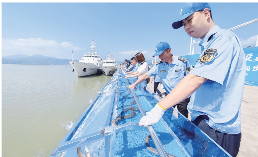
增殖放流活动福州主会场

据了解,“十四五”以来,全省投入各类资金超2亿元,放流海淡水鱼类、贝类、虾蟹类以及珍稀濒危物种56种、苗种超269亿尾(粒、只),放流区域覆盖全省沿海近岸海域和内陆江河湖泊。